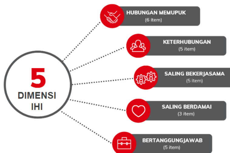
Rajah 1.2 Lima (5) Dimensi IHI

Malah, setiap data akan dapat dianalisis mengikut skor IHI bagi setiap syarikat dan diperincikan skor mengikut negeri, zon, sektor, saiz syarikat, status berkesatuan sekerja dan setiap soalan berkaitan demografi.